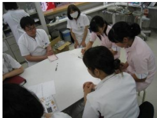
ミーティング風景

病棟では看護師の職業体験として入院患者様の日常生活を見学しながら、検温や食事介助などの援助を体験してもらいました。他には訪問看護・デイナイトケア・相談室・事務・検査・薬局・栄養科・作業療法などの資格取得の方法を含めて仕事の説明や見学をしていました。今回の職場体験を通して、仕事をする楽しさや厳しさを体験することが出来たと思います。この経験を今後の進路を決めていく上で役立ててもらえればと思います。