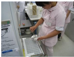
調剤業務の疑似体験